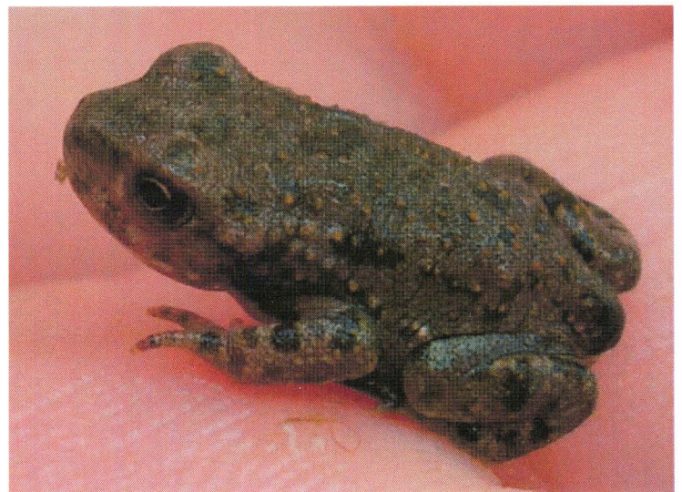
Ravlunda (Plattan) 04.07.22