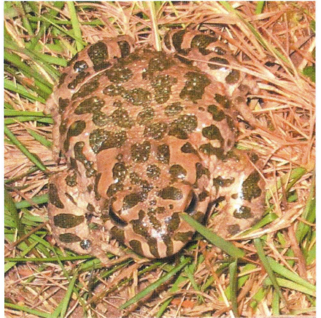
Ravlunda (Alriks korra) 04.05.07