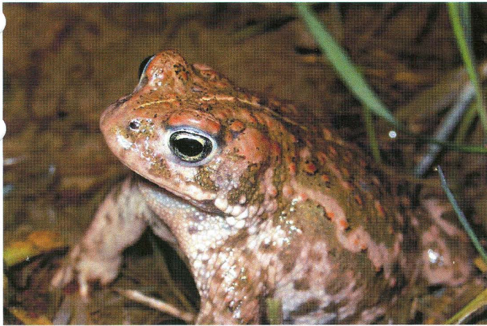
Högaborg (Johnmarks korra) 04.05.06